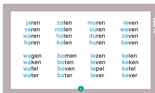
Twee pagina's uit 'Veilig & vlot'