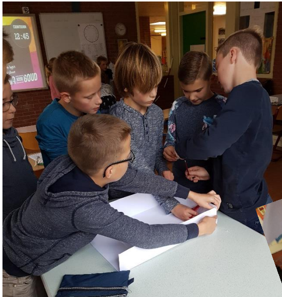
Samen werken aan het kippenhok.

Bouw een kippenhok met papier, plakband en waarop een ei kon blijven liggen.