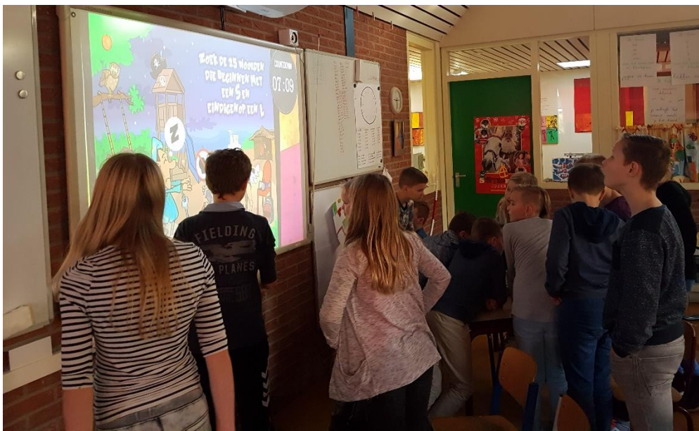
Zoek 25 woorden in het plaatje die beginnen met een S en eindigen op een L.