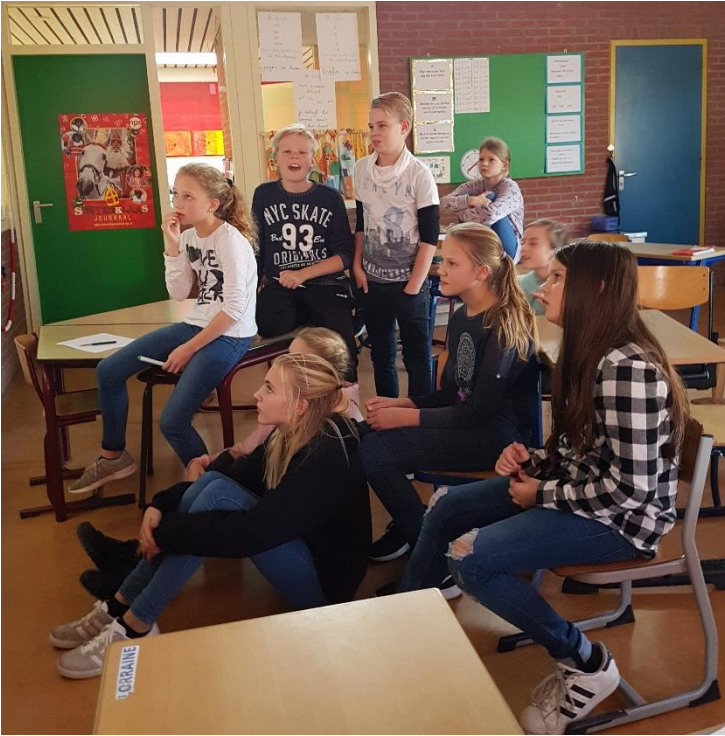
Aandachtig luisteren naar een hoorspel met een raadsel.